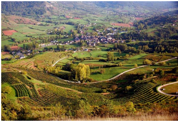
Claivaux d'Aveyron. Vue des coteaux plantés de vignes de la vallée de l'Ady, avec les villages de Clairvaux (au premier plan) et Bruejouls (au second plan). Source wikimedia

sont classés aujourd'hui en paysages culturels : l'ancienne juridiction de Saint-Emilion en France 1999, la vallée du Haut-Douro au Portugal 2001, la côte de Tokaj en Hongrie 2002, Paysage viticole de l'île de Pico - Açores au Portugal 2004, Lavaux en Suisse 2007. D'autres paysages sont classés culturels et pour lesquels la vigne joue un rôle majeur : Portovenere - Cinque Terre et les îles (Palmaria, Tino et Tinetto) 1997, Wachau en Autriche 2000, le Val de Loire en France 2000. Enfin les paysages culturels pour lesquels la vigne joue un rôle mineur sont : - Paysage culturel de Fertö / Neusiedlersee - Burgenland, Autriche et Comté de Győr-Moson-Sopron, en Hongrie 2001, Vallée de l'Orcia - Province de Sienne, Toscane en Italie 2004, Bordeaux, Port de la Lune en France 2007.