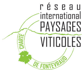
Charte de Fontevraud

L'IFV entretient une dynamique de projets et de réseaux sur les paysages viticoles depuis par le groupe national « Paysages viticoles » . Concrètement, des outils pour des projets de développement durable paysages ont été développés dans la cadre du projet APPORT, agriculture et paysage (1, 2, 3, 4, 5, 6, 7 et 8), pilotés par IFV, lauréat à l'appel à projets de développement agricole et rural d'innovation et de partenariat du CASDAR 2006. Particulièrement pour les paysages viticoles, l'IFV est missionné depuis 2008 pour animer et développer la Charte Internationale de Fontevraud (39). L'institut Français de la Vigne et du vin est aussi pilote dans un projet européen life+ Biodivine dont le but est de démontrer la biodiversité fonctionnelle dans les paysages viticoles ( www.biodivine.eu ).