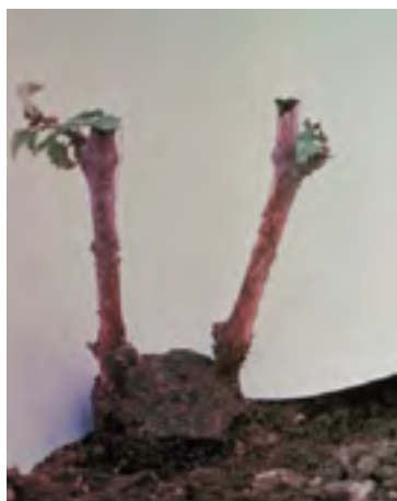
Exemples de greffages en fente : à un greffon sur jeune sujet, à deux greffons sur sujet de gros diamètre.

La troisième technique, le curetage , a été récemment remise au goût du jour par la Sicavac. Utilisée depuis l'Antiquité par les vignerons, elle consiste en l'ouverture des pieds malades pour rendre visibles les tissus ligneux dégradés par l'action des champignons. Le bois mort semblable à l'amadou, caractéristique de l'esca, est ensuite retiré par une tronçonneuse et la souche est laissée ouverte. En l'absence de mesures claires à grande échelle, l'efficacité réelle de cette pratique sur le prolongement de la vie des ceps est inconnue à ce jour.