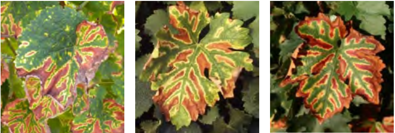
Tigrures de feuille chez le Savagnin (à gauche), le Sauvignon (au milieu) et le Cabernet-Sauvignon (à droite).

Les premiers symptômes d'esca se manifestent vers le début de l'été. Cette maladie présente une forme lente caractérisée par des taches nécrotiques bordées d'un liseré jaune sur les feuilles. A des stades plus avancés, ces nécroses sont plus importantes, ne laissant qu'une bande verte le long des nervures principales, ce qui donne un aspect tigré à la feuille. Elle peut toucher soit toute la plante, soit un seul bras ou encore quelques rameaux. Ces symptômes commencent par les feuilles situées à la base du rameau.