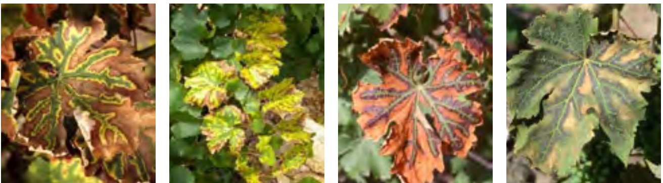
Tigrures de feuilles chez le Sauvignon blanc (à gauche), le Chardonnay (au milieu, à gauche), le Cabernet-Sauvignon (au milieu, à droite et à droite).