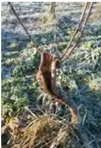
Aspects de souches après curetage.