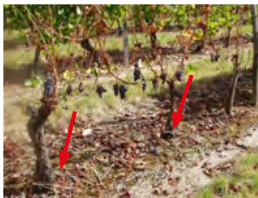
A gauche : marcottage à partir d'un rameau, à droite : double marcottage à partir de pampres à la base ; l'apoplexie de la souche initiale a entraîné la mort des deux souches-filles.