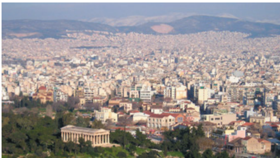
Vue d'Athènes - L'agora et le temple de Théséion

Contact : Thierry Dufourcq Station régionale ITV Midi-Pyrénées (basé au Domaine de Mons - Gers) Tél. 05.62.68.30.39.