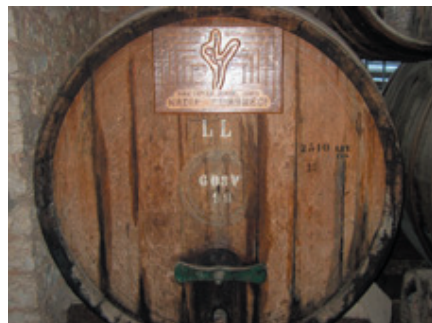
Barrique Nectar Ktima Merkouri - Chai Achaïa Clauss