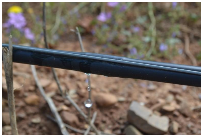
Fig. 1. Système d'irrigation au goutte-à-goutte en viticulture

augmenter l'efficacité de l'utilisation de l'eau en réduisant de 50 % la consommation en eau par rapport à l'irrigation par sillons et en réduisant l'engorgement. L'irrigation goutte à goutte aérienne (Fig. 1) est une technique innovante qui utilise des goutteurs surélevés par rapport au sol, généralement suspendus à des systèmes de treillis ou à des fils de fer en milieu agricole. Bien que moins répandus que l'irrigation goutte-à-goutte au sol classique, les systèmes aériens présentent des applications et des avantages spécifiques.