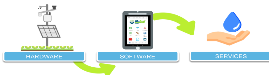
Fig. 7. Méthode de communication entre le matériel et le logiciel –groupe opérationnel OLTREBIO