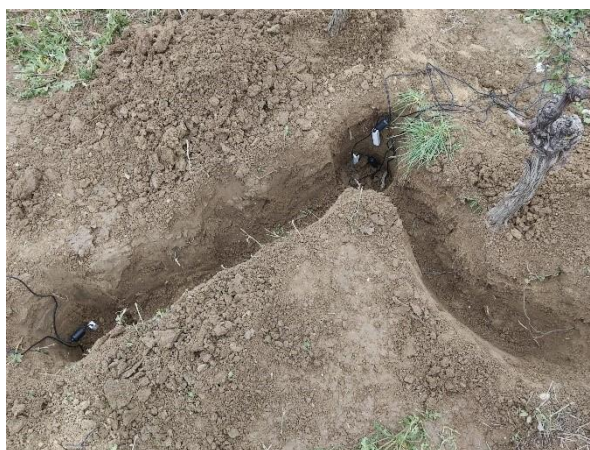
Fig. 2 Utilisation d'une sonde capacitive pour étudier le comportement de l'eau dans le sol – groupe opérationnel OFIVO