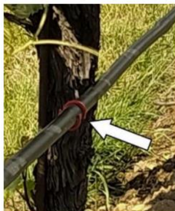
Fig. 5. « Pinces Hydro » appliquées aux goutteurs pour les fermer, moduler leur pas et obtenir un système de goutte-à-goutte à débit variable – groupe opérationnel VIRECLI

En 2021 et 2022, années de grande sécheresse, grâce à l'irrigation de précision, les zones de faible vigueur ont produit 15 % de raisins en plus par plant que les zones du même vignoble présentant une vigueur similaire mais irriguées avec le système de goutte-à-goutte standard. La gestion de l'irrigation à débit variable a permis d'économiser 15 % d'eau par rapport au système d'irrigation non modulaire, tout en répondant mieux aux besoins de chaque plant.