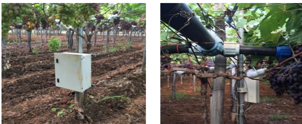
Fig 6. Capteurs au niveau du sol et des vignes – groupe opérationnel OLTREBIO

La consommation d'eau d'un vignoble de raisin de table de 2 ha dans la région des Pouilles (sud de l'Italie) peut varier de 2 000 à 6 000 litres par saison, en fonction de la méthode d'irrigation utilisée et des besoins spécifiques de la variété, ce qui souligne l'importance de l'efficacité de l'utilisation des ressources. Le groupe opérationnel OLTREBIO [5] a mis en place des capteurs interconnectés sur une exploitation au niveau du sol et des vignes (Fig. 6), qui communiquaient avec un outil d'aide à la décision (OAD) pour la gestion de l'eau dans les vignobles de raisin de table biologique, afin d'optimiser les ressources. L'utilisation de l'eau est enregistrée et gérée sur une base saisonnière à l'aide de capteurs IoT à différents niveaux (sol et culture) qui utilisent les données météorologiques obtenues localement (Fig. 7.). Les données sont recueillies dans le logiciel Blueleaf®. L'OAD, élément clé, est adapté au vignoble de raisin de table et joue un rôle crucial dans la gestion de l'utilisation de l'eau pendant les périodes critiques de pénurie d'eau. L'avantage pour les utilisateurs est l'utilisation rationnelle des ressources en eau, qui permet d'économiser environ 30 à 40 % d'eau en fonction des tendances saisonnières et du temps de travail du viticulteur, sans compromettre la production végétale ou la qualité des fruits.