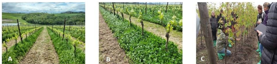
Fig. 3. Les photos A et B montrent le trèfle au stade végétatif maximal, tandis que la photo C montre le trèfle après sa mort, celui-ci continuant à recouvrir le sol sous forme de paillis mort [8]

Le groupe opérationnel IOCONCIV [7] a étudié l'utilisation d'un couvert végétal qui se réensemence de lui-même sous un rang de vigne en Toscane, en Italie (Fig. 3). Le couvert permanent était le Trifolium subterraneum ssp. brachycalycinum en raison de sa capacité d'auto-ensemencement, permettant différents cycles pendant 3 à 4 ans. La sous-espèce brachycalycinum a évolué pour résister aux sols secs et est mieux adaptée aux sols argilo-limoneux subcalcalins. La biomasse du trèfle sert de paillis vivant en automne, en hiver et au printemps, et se transforme en paillis mort en été, ce qui a pour effet de réduire la concurrence avec les vignes pour l'eau et les nutriments et de réduire le stress dû à la sécheresse en raison de la couverture du sol pendant l'été. À la fin de l'été, la germination spontanée des graines de trèfle entame un nouveau cycle biologique sous les rangs, offrant des avantages tels que la suppression de la levée des mauvaises herbes et l'amélioration de la fertilité du sol.