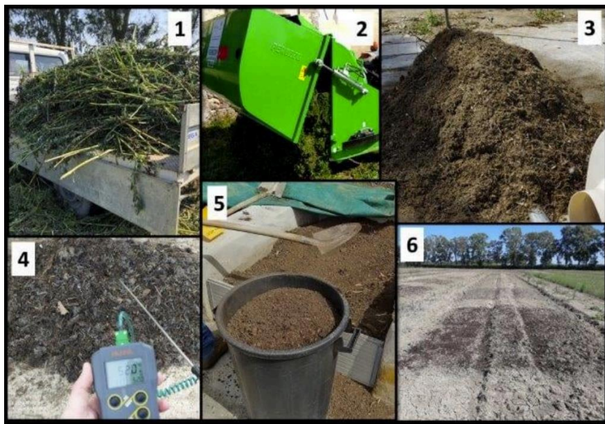
Fig. 1. Compostage sur l'exploitation réalisé par l'exploitation expérimentale CREA-AA : 1. collecte des déchets agricoles ; 2. broyage et mélange ; 3. préparation et oxygénation du tas ; 4. contrôle de la température et de l'humidité ; 5. stockage du compost mûr ; 6. épandage sur place [3]

Le compost mûr a été épandu pendant trois ans comme engrais dans des vignobles de raisin de table biologique à raison de 2,1 tonnes/ha, ce qui a permis de réduire les intrants et le carburant utilisés par l'exploitation de 70 % et 10 %, respectivement.